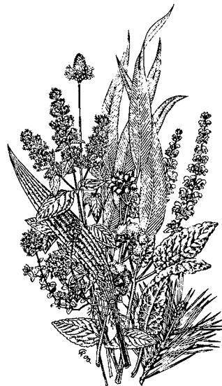
Heilpflanzen im WALA-Garten